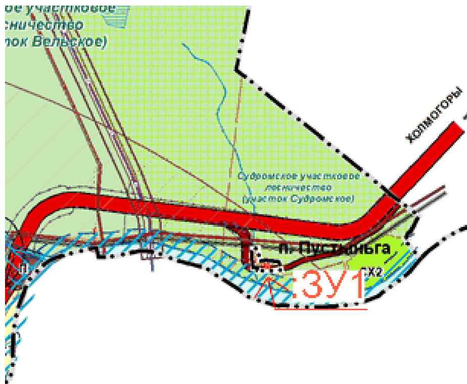
Схема расположения земельных участков на карте градостроительного зонирования