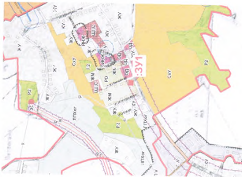
Схема расположения земельных участков в границах земельного планировочной структуры (вариант № 1:5000)