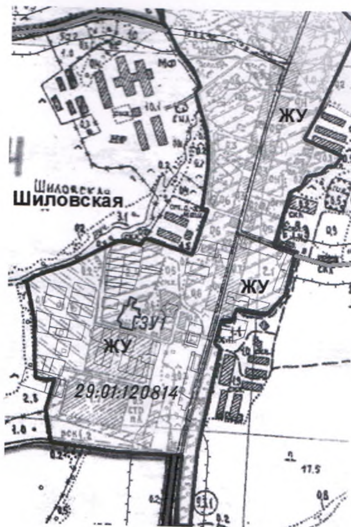
Схема расположения земельных участков на карте градостроительного зонирования